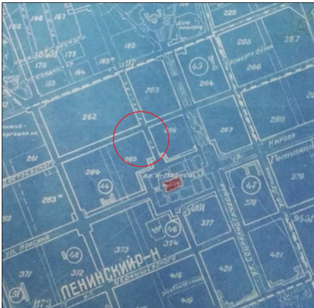
Схема 2. Расположение объекта на фрагменте «ГЕНПЛАН г. Уфы 1941 года». ГБУ НА РБ Ф. Р-1250. Оп.2. Д.161.