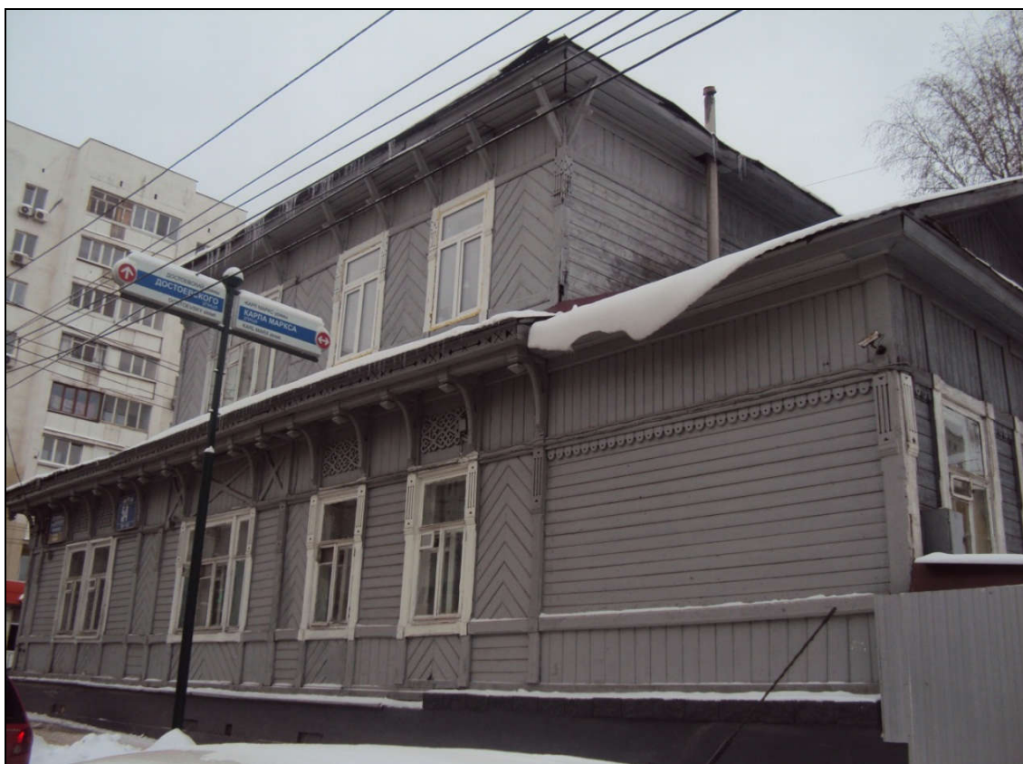
Угол дома. Северный фасад.