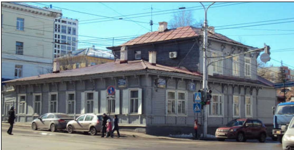
Угол дома (северо-восток).

для памятника – снимки общего вида, фасадов, предмета охраны данного объекта.