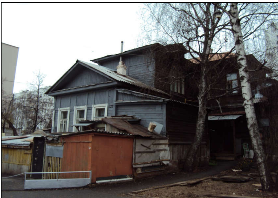
Фото со двора (западная часть).